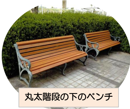
丸太階段の下のベンチ