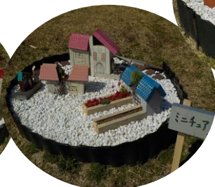
多肉植物と小さな町