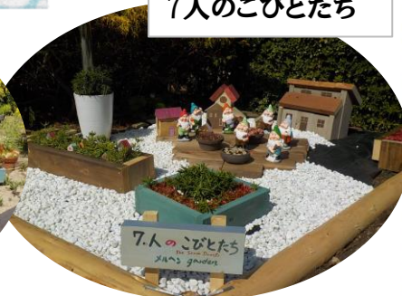
新たに登場！ 7人のこびとたち