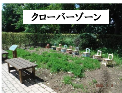
クローバーゾーン