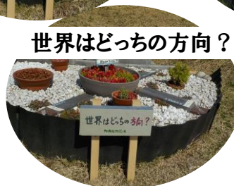
世界はどっちの方向？